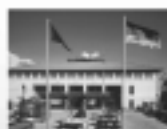
China, Deutsche Botschaft